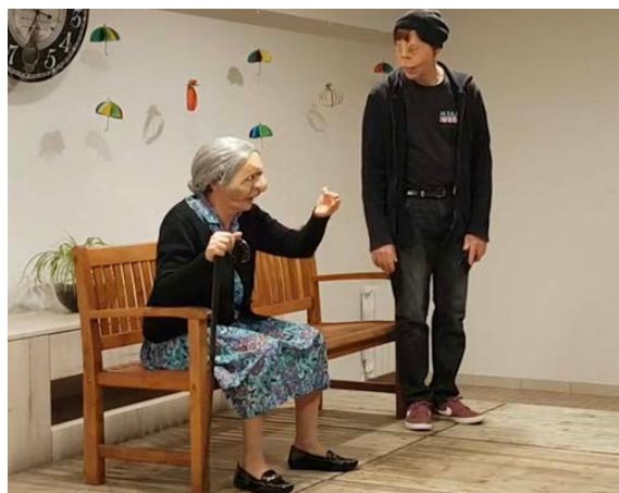
Atelier avec les résidents de La Petite Provence à Charlieu