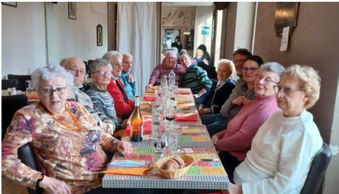
Sortie au restaurant en conclusion de notre projet

Les méthodes et les moyens des techniques théâtrales ne seront pas utilisés comme fins en soi, mais comme vecteurs de cohésion intergénérationnelle et d'ouverture sur les autres.